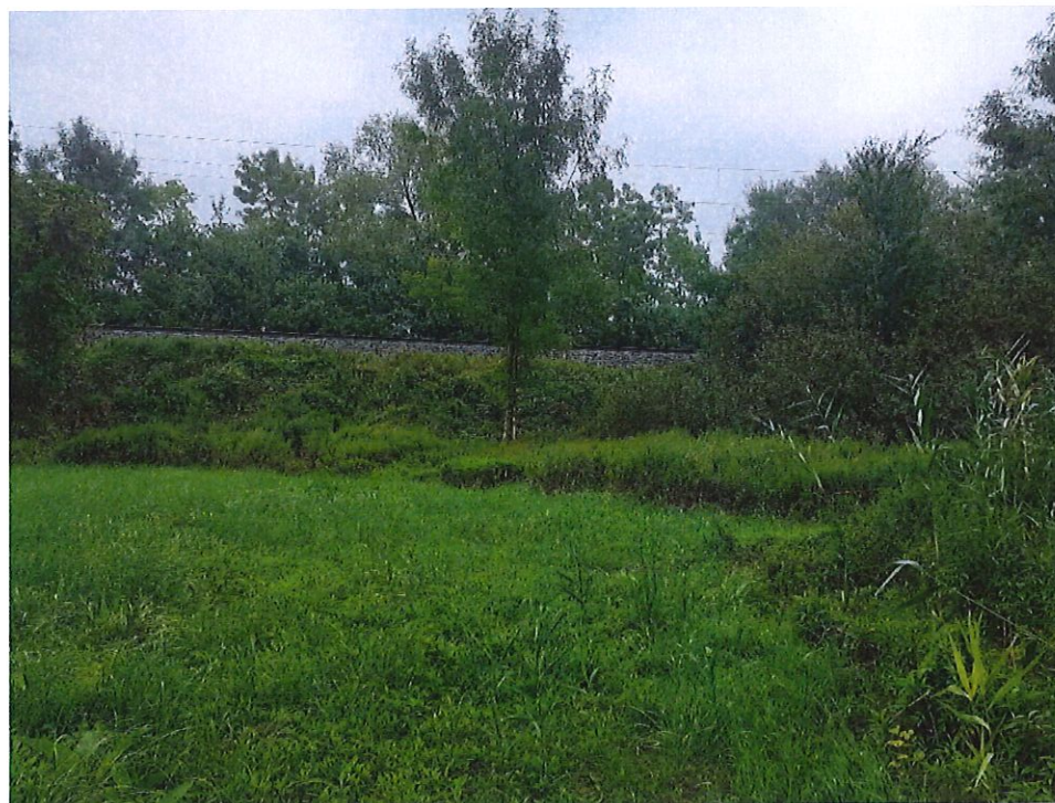
Obhliadka miesta budúceho zariadenia staveniska pri moste cez rieku Morava