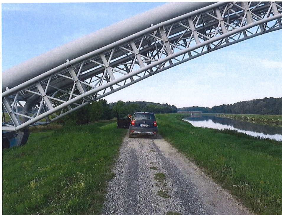
Obhliadka súčasného stavu prístupových komunikácií pri moste cez rieku Morava